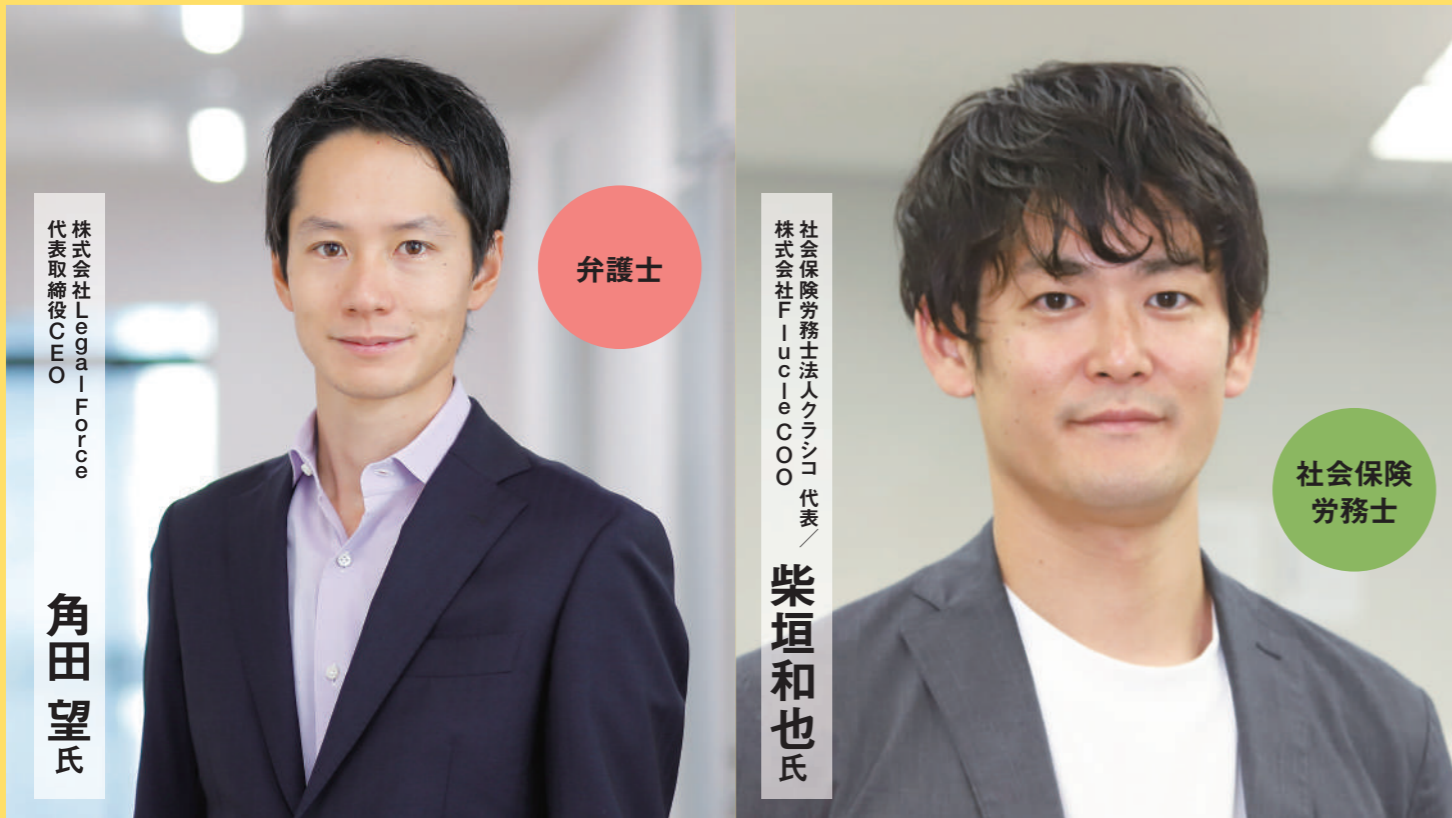
株式会社LegalForce 代表取締役CEO