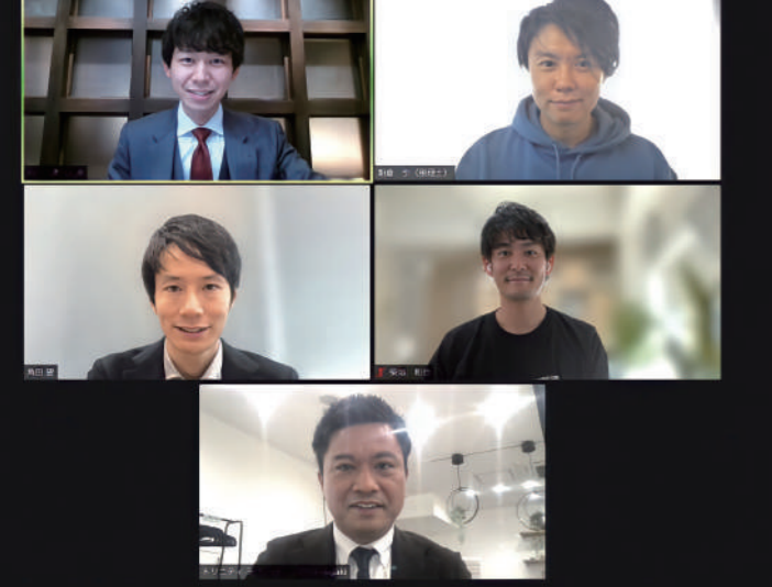
それぞれがシステム開発にも携わっているため、士業事務所の視点とIT企業の視点から業界の未来や士業の在り方の変化を予測