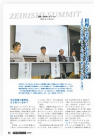
FIVE STAR MAGAZINE (2024年1月)