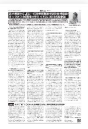
税界タイムズ (2024年2月)